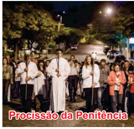
Procissão da Penitência