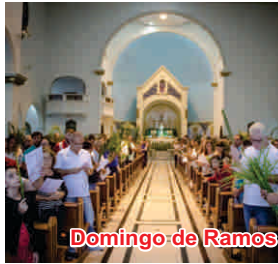
Domingo de Ramos na Paixão do Senhor