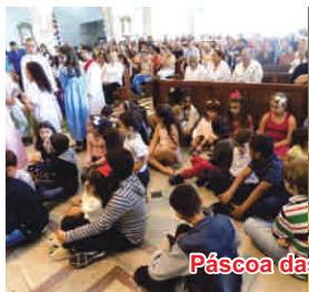
Páscoa das Crianças