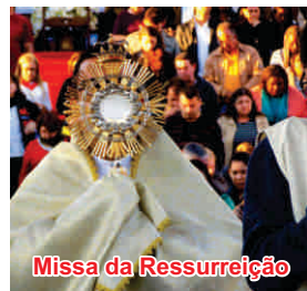
Missa da Ressurreição