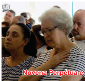
Novena Perpétua e Unção dos Enfermos