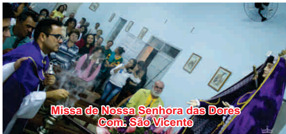
Missa de Nossa Senhora das Dores Com: São Vicente