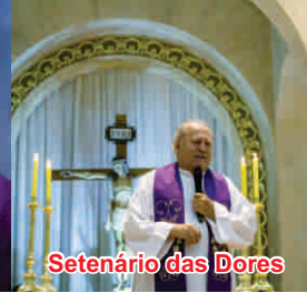
Setenário das Dores