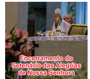
Encerramento do Setenário das Alegrias de Nossa Senhora