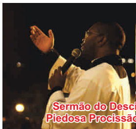
Sermão do Descimento da Cruz e Piedosa Procissão do Senhor Morto