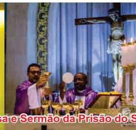
Missa e Sermão da Prisão do Senhor