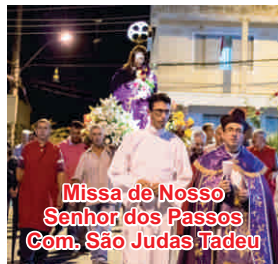
Missa de Nosso Senhor dos Passos Com: São Judas Tadeu