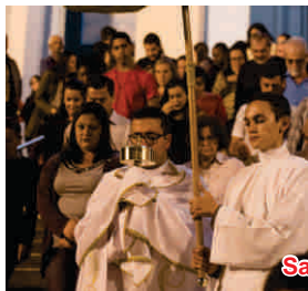
Santa Missa da Ceia do Senhor