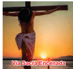
Via Sacra Encenada