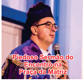
Piedoso Sermão do Encontro na Praça da Matriz