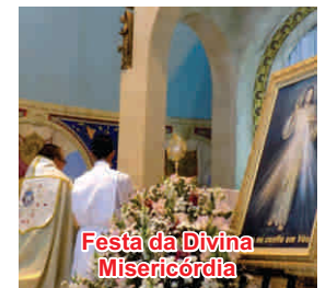
Festa da Divina Misericórdia