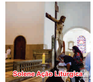
Solene Ação Litúrgica