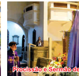
Procissão e Sermão de Nossa Senhora das Dores