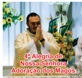
4ª Alegria de Nossa Senhora Adoração dos Magos