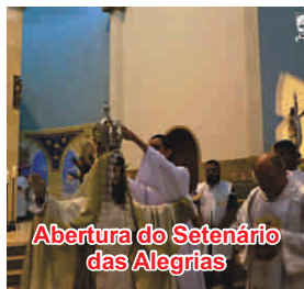
Abertura do Setenário das Alegrias